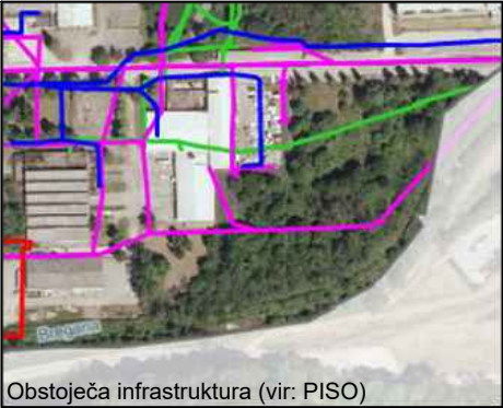
Obstoječa infrastruktura

infrastruktura Območje ima zgrajeno kanalizacijsko omrežje. Kanalizacijski sistem se navezuje na centralno čistilno napravo Obrežje. Kanalizacijski in vodovodni vod potekata čez območje OPPN. Obstoječi objekti v neposredni bližini so priključeni v elektroenergetsko omrežje. Ob severnem delu območja OPPN poteka cestna razsvetljava. Opomba: Čez območje OPPN, kot izhaja iz PISO, poteka kanalizacijsko omrežje, ki je v geodetskem posnetku prikazano ter tudi vodovodno in komunikacijsko omrežje, ki pa v geodetskem posnetku nista prikazana. varovana območja OPPNe ne posega na varovana območja - niti na območje kulturne dediščine ali ohranjanja narave ali varstva voda. Območje OPPN posega na območje majhne in preostale poplavne nevarnosti.